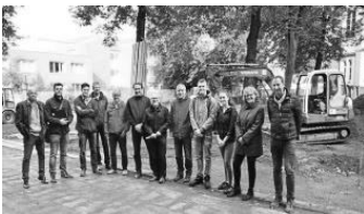
Baustelle Schulhof (Datenquelle: WN)