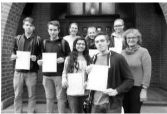
Well done! – Cambridge-Zertifikate verliehen