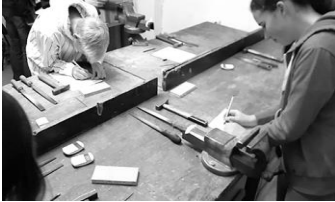
Potenzialanalyse Klassen 8