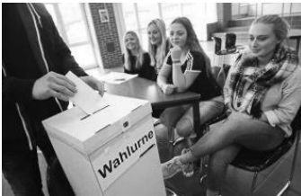
Wahlgeheimnis gewahrt - Juniorwahl 2017