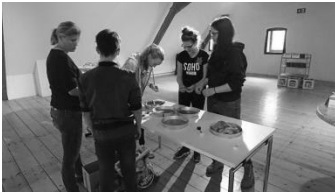
MINT auf Schlössern, 9b