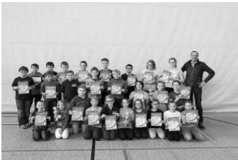
Stadtfestlauf - Siegerehrung