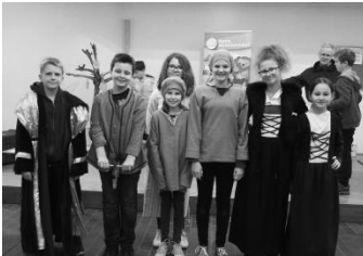
Martin Luther kennenlernen - 6a und 6e