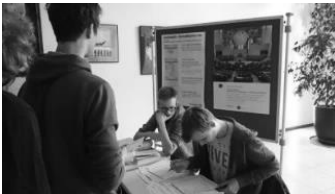
Wählerregistrierung bei der Juniorwahl 2017