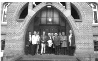
Abiturientia 1957 zu Gast am Anton

schaft des Stenografenvereins Dülmen gleich in zwei Disziplinen den ersten Platz. Ebenfalls vordere Plätze belegte die Schülerin im Schnell- und Perfektionsschreiben. Hierzu herzlichen Glückwunsch!