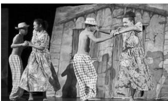
Tanzgruppe „Verde Vida“ (Datenquelle: WN)

das Schuljahr 2017/2018 ist zwar noch sehr jung, aber in den letzten Wochen hat sich bereits viel am Anton ereignet. Mit diesem Elternbrief möchte ich einige Momente mit Ihnen teilen.