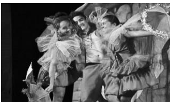
Tanzgruppe „Verde Vida“ (Datenquelle: WN)