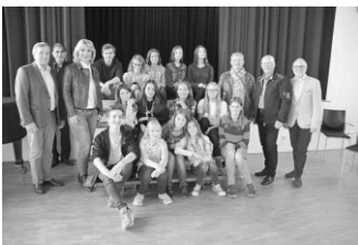
Spende Bürgerstiftung