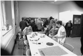
Tag der offenen Tür 18.11.2017