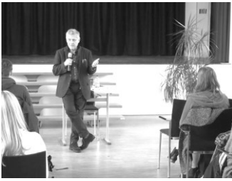
Der Kommunismus in seinem Zeitalter