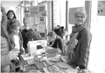
Tag der offenen Tür 18.11.2017