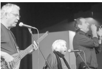
Konzert „Esther Bejarano“

die Weihnachtsferien stehen bevor und seit dem letzten Elternbrief hat das Anton viel erlebt: