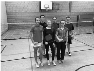
Badminton-Turnier am Anton

die Fachschaft Geschichte zum Anlass, die Ausstellung „ Der Kommunismus in seinem Zeitalter “ für vier Wochen zu präsentieren. Die Geschichtsoberstufenkurse erhielten durch einen Vortrag von Gerd Koenen, dem Ausstellungsmacher, einen überraschenden, informativen und lebendigen Überblick zur Geschichte des Kommunismus im 20. Jahrhundert.