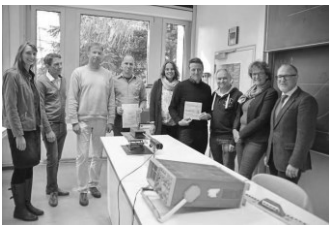
Übergabe MINT-Zertifikat