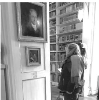
Im Angesicht Goethes in Weimar